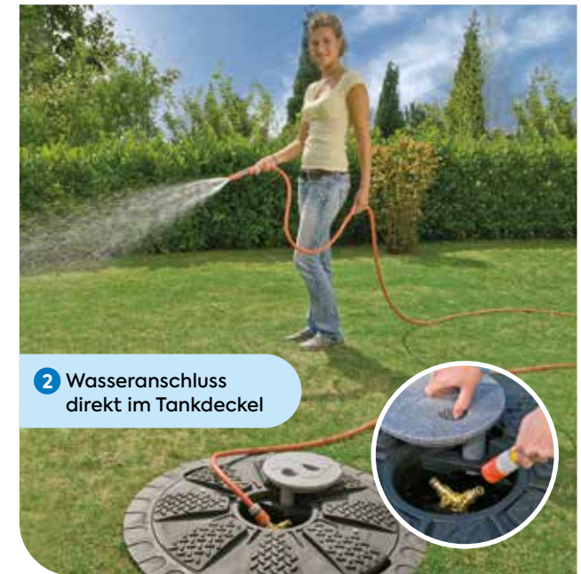
2 Wasseranschluss direkt im Tankdeckel

** Die Aktionspreise sind bei Bestellung bis zum 30.09.2023 gültig.